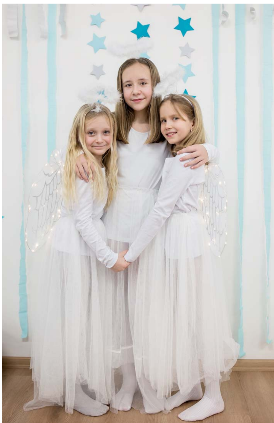
Zálezelské andělky při vítání nejmenších občánků Dolních Zálezel.