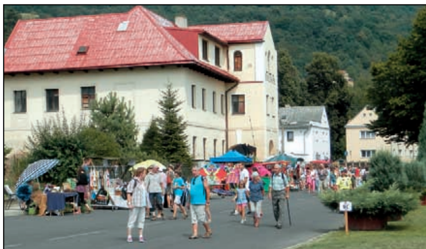
Obnovili jsme po 50 letech slavnosti meruňek. FOTOREPORTÁŽ NA STR. 6-8