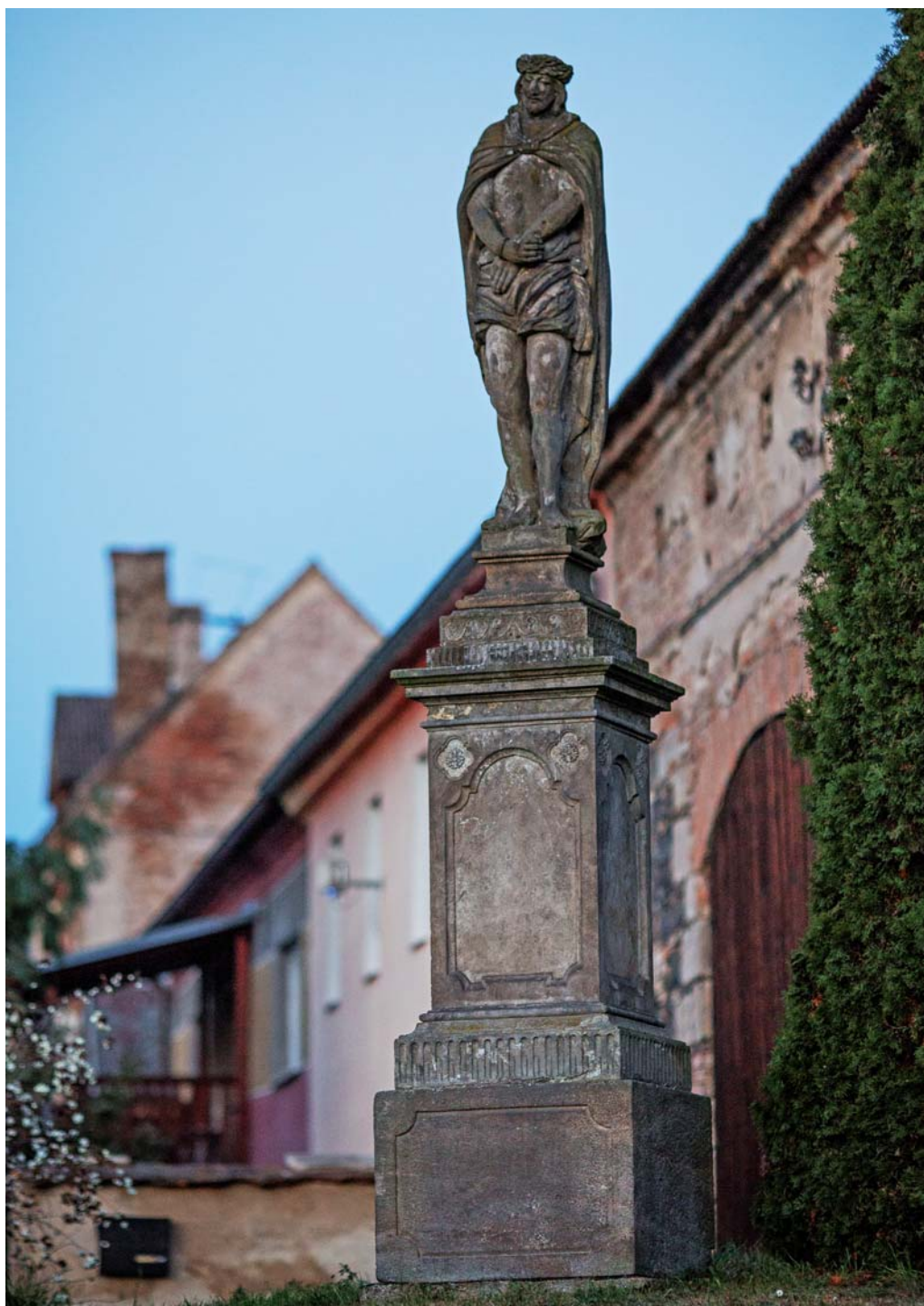
Němý svědek historie - socha ECCE HOMO z roku 1820