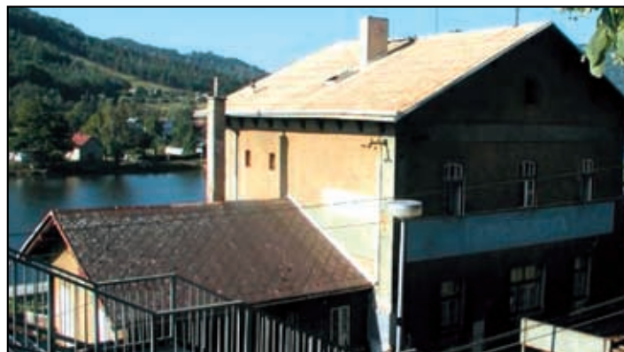
Nádražní budova před rekonstrukcí v roce 2004