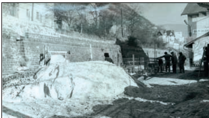
Přestavba nástupiště koncem 70. let 20. století.