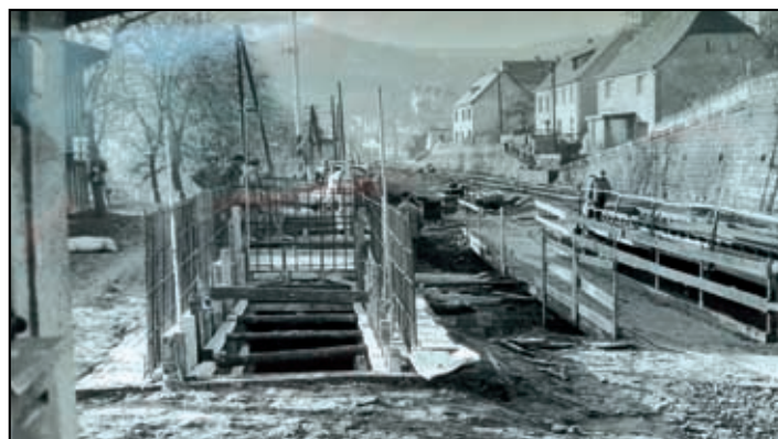
Do provozu uvedeno v prosinci 1979