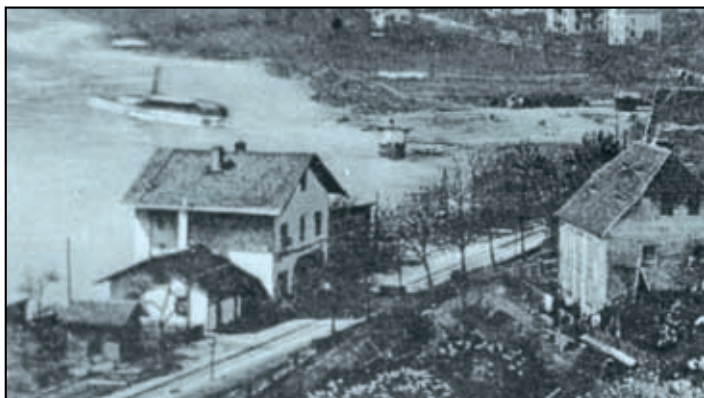
Nádraží kolem roku 1903

Nádražní budova v Dolních Zálezlech byla postavena v roce 1850 a je jedinou zachovanou budovou v původní podobě podle projektu Aloise Negrelliho (nejznámější stavba Negrelliho viadukt v Praze) a Bedřicha Schnircha (nejznámější stavba Stádecký řetězový most na Lužnici). Od roku 1958 je chráněna jako kulturní památka.