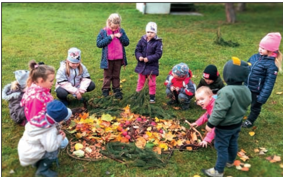
Mandala pro radost od dětí z naší MŠ

Stejně jako v loňském roce jsme i v letošním roce připravovali pro naše jubilanty, kteří v letošním roce oslavili nebo oslaví 70, 75, 80, 85 a více let, několik setkání a chtěli jsme jim osobně pogratulovat k jejich výročí. Situace s koronavirem nám to bohužel ani na jaře, ale ani teď na podzim nedovolila. Přestože pevně věříme, že ještě bude mnoho příležitostí si to vynahradit, rádi bychom všem, kteří v tomto roce oslavili nebo oslaví významné životní výročí popřáli mnoho krásných dní, spoustu štěstí, pevné zdraví, plnou náruč radosti, a především žádné starosti! S drobným dárkem se u všech zastavíme hned, jak to bude možné a pro všechny bezpečné.