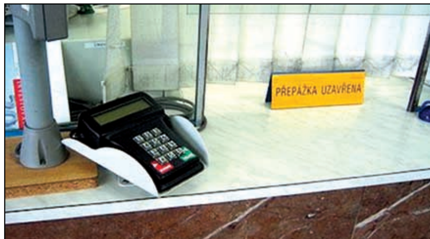
V žádném případě pošta v obci zrušena nebude.