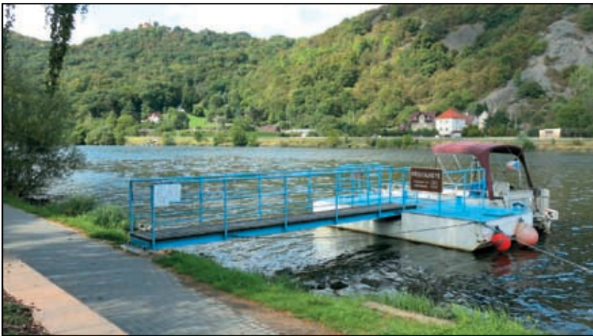
Dne 21. 5. byl zahájen přívoz Dolní Zálezly - Církvice.

Zdržel se: .....0 Zastupitelé obce schválili smlouvu o pořízení územně plánovacího podkladu.