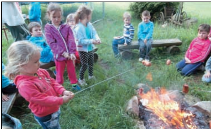
Za podpory OU vyjely děti na školu v přírodě. Čtěte na straně 7 a 8.