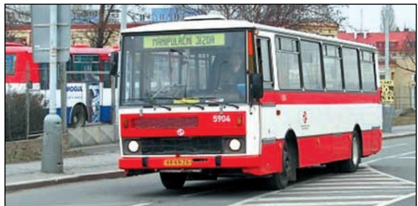
Obec Dolní Zálezly byla přeřazena do jiného pásma, než je Ústí nad Labem

■ akce likvidace bioodpadu dle zákona v obci je ukončena. Občanům byly do domácností rozvezeny kompostéry. Obec obdržela jeden kontejner na bioodpad a jeden štěpkovač. Ze státního