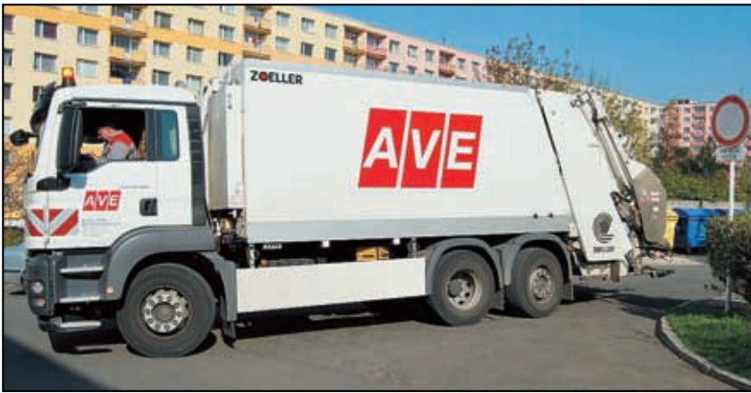
Firma AVE zajišťuje pro obec odvoz odpadu z domácnosti.