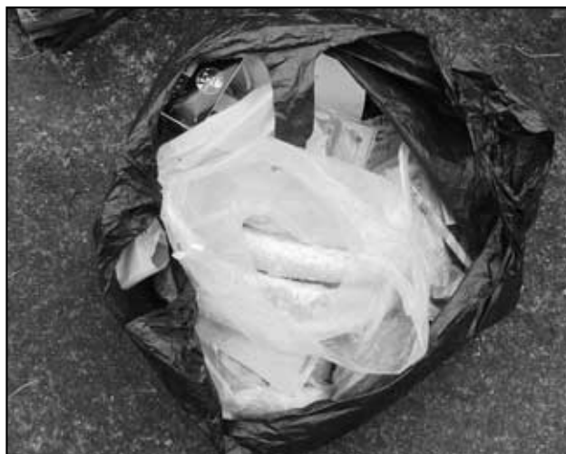
Neuvěřitelné! Někdo odhodil do kontejneru na plast pečivo!!!