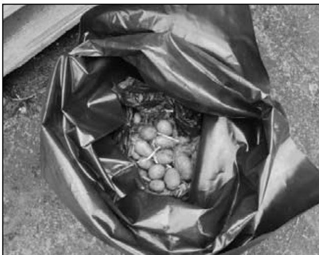
Brambory v kontejneru na plast!!!