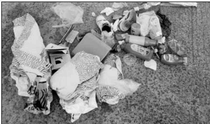
Povlečení z postelí a boty do kontejneru na plast nepatří !!!