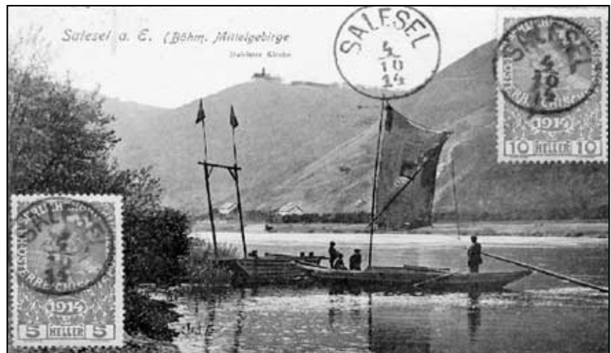
Naše obec na historické fotografií.