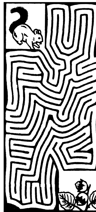
Pomůžete najít veverce cestu k oříšku...?

■ „Ten váš malej je strašnej simulant!“ žaluje rodičům babička. „Říkáte, že má vysokou teplotu a zatím má nos studený jako psí čumák!“ „Ale babičko,“ uklidňuje ji maminka, „Filípek se dívá na televizi... A v jeho posteli leží Alík!“