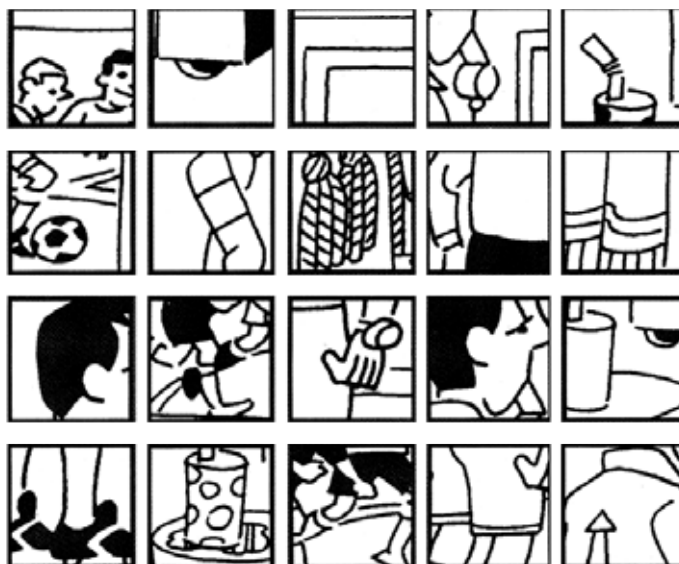
Z dvaceti výřezů umístěných vedle obrázku jsou pouze čtyři, které z něho byly vyjmuty. Najdete je?