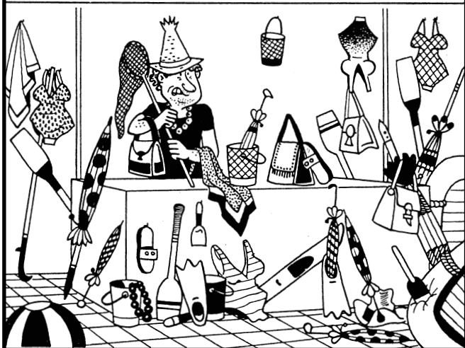
Poznáte co si slečna z obchodu odnesla?

■ Ptá se otec sedmnáctiletého synka: „Kam jdeš? A proč si s sebou bereš tu baterku?“ „Jdu na rande,“ odpoví synátor. „To já ve tvých letech žádnou baterku nikdy nepotřeboval,“ poznamená otec. „No, ale taky se podívej, co sis přivedl domů!“