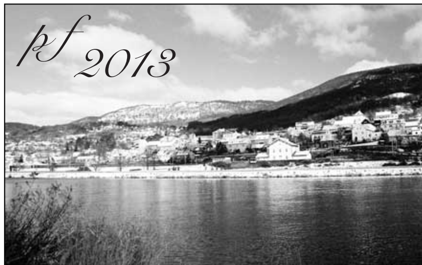
Zimní pohled na naši obec.