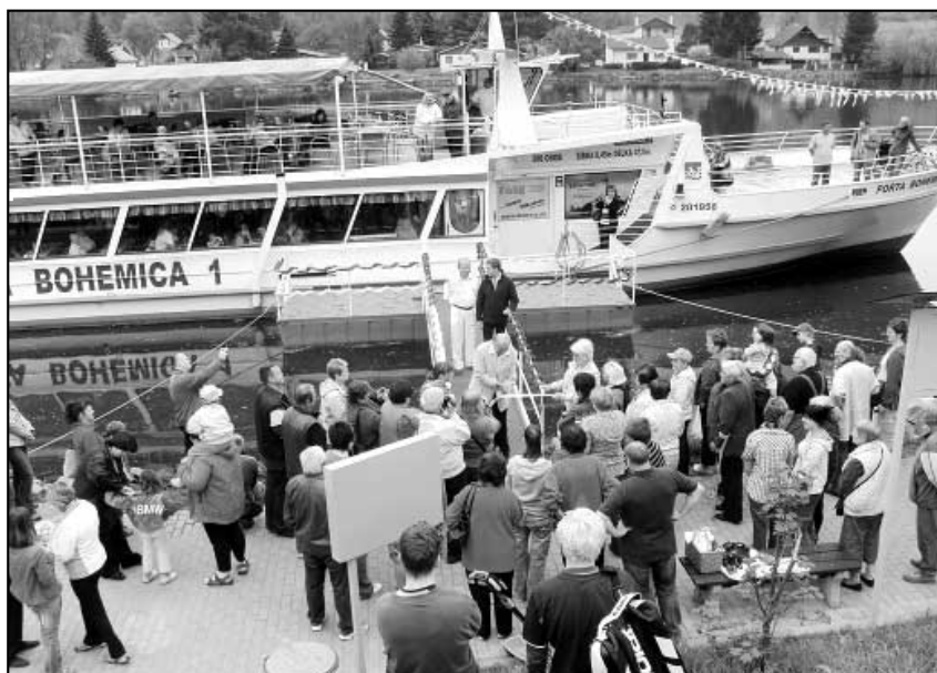
Slavnostní otevření přístavního mola ze dne 2. května 2010 a tím obnovení osobní lodní dopravy v obci Dolní Zálezly.