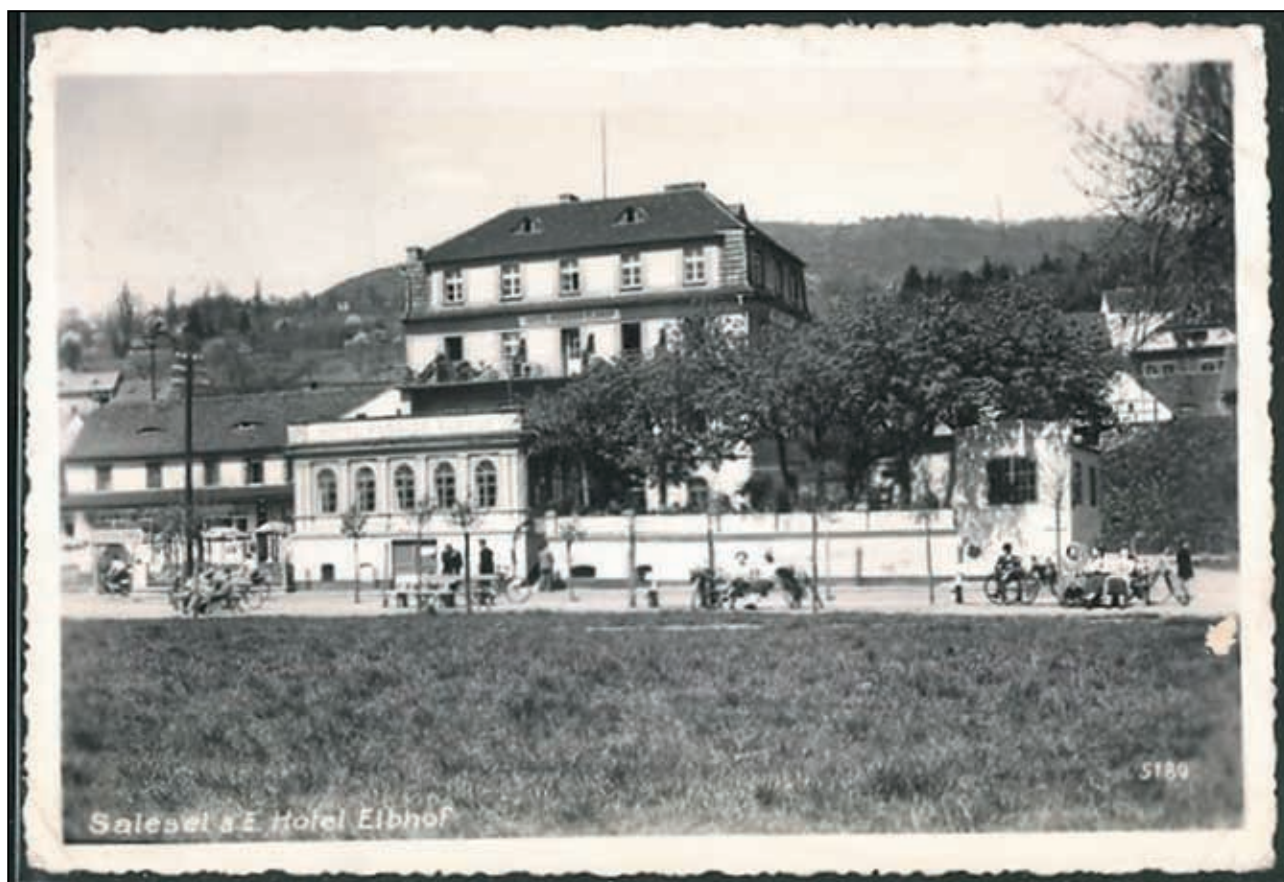
Foto z rekonstrukce kulturního domu Labe