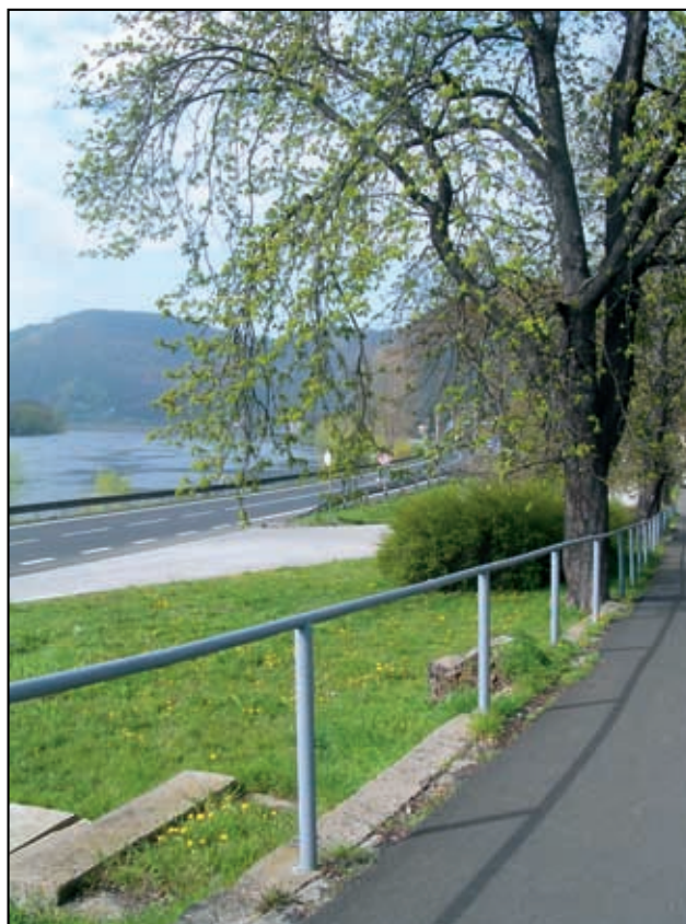
Po dlouhé zimě přicházejí krásné jarní dny.

Zastupitelstvo se bude rozhodovat, jakou barevnou podo-