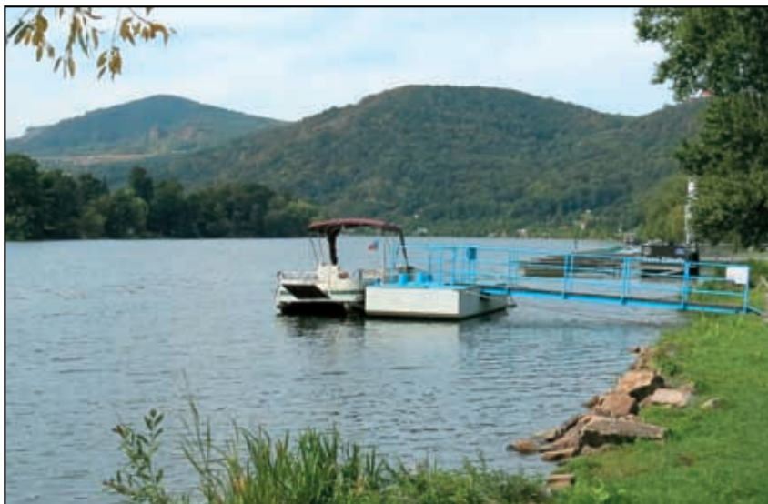
Není jisté, zda letos bude v provozu přivoz z Dolních Zálezel do Církvic.