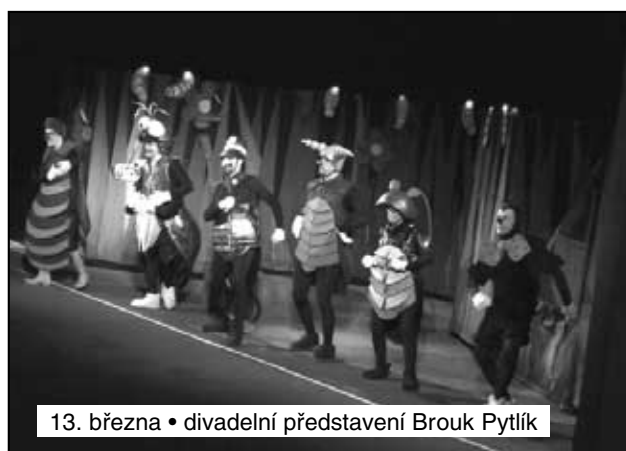
13. března • divadelní představení Brouk Pytlík