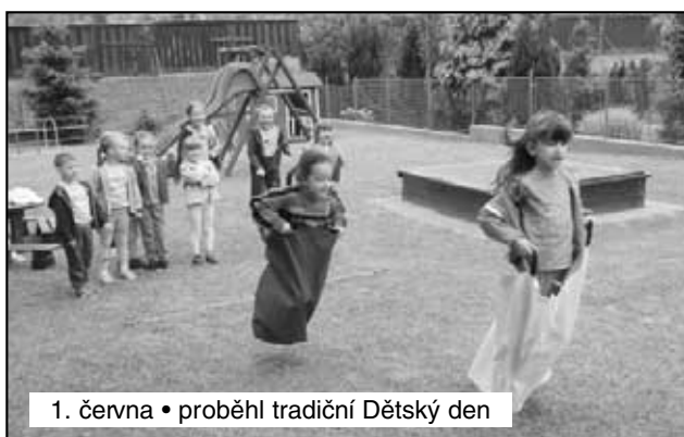
1. června • proběhl tradiční Dětský den