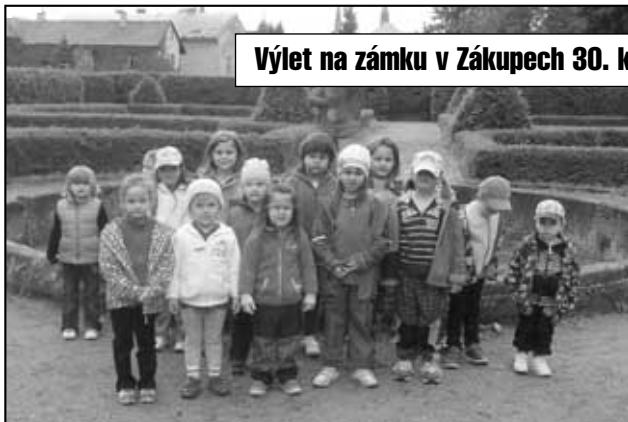
Výlet na zámku v Zákupích 30. května