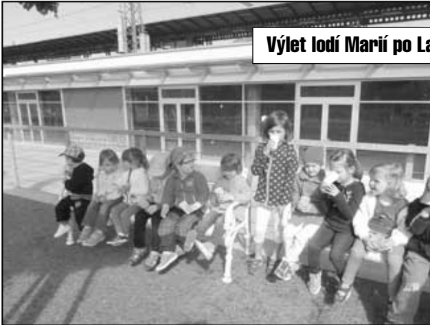
Výlet lodí Marií po Labi 4. června