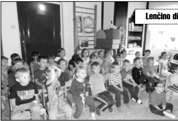
Lenčino divadlo 3. června