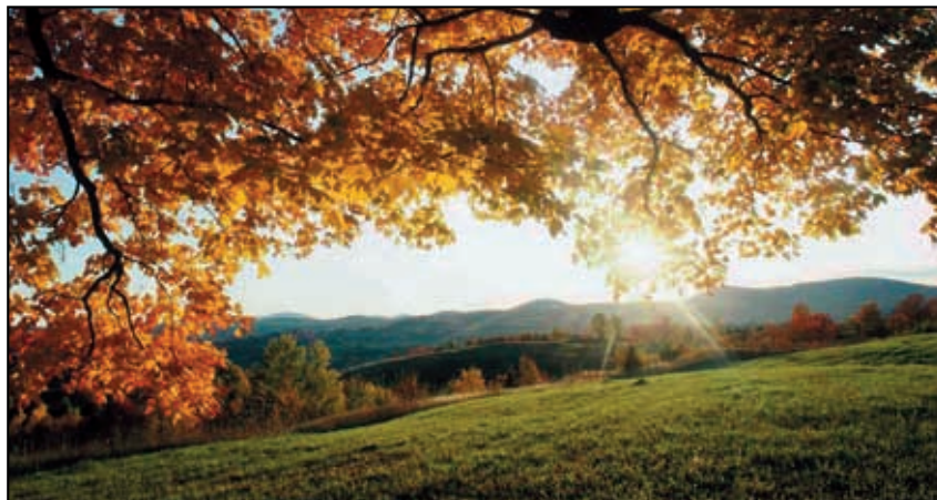
Nadešel čas barevného podzimu.